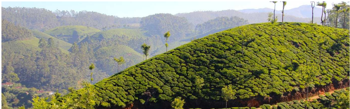
Teeplantagen im Hochland

Örtliche Gegebenheiten oder aktuelle, unvorhergesehene Anlässe sind gelegentlich der Grund für Änderungen des Reiseprogramms. Sofern dies keine Leistungseinbußen mit sich bringt, obliegt es der örtlichen Reiseleitung, Änderungen im Ablauf vorzunehmen.