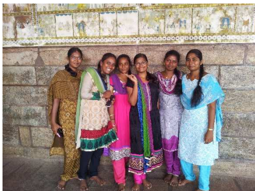
Im Meenakshi Tempel in Madurai

Alle Uhrzeiten sind Ortszeiten. (+1) = Ankunft am nächsten Tag