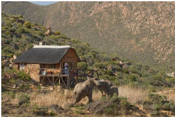
Aquila Game Reserve