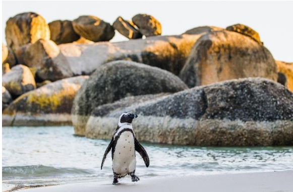
Boulders Beach Pinguinkolonie

Örtliche Gegebenheiten oder aktuelle Anlässe sind manchmal der Grund für Änderungen des Reiseprogramms. Sofern dies keine Leistungseinbußen mit sich bringt, obliegt es der örtlichen Reiseleitung, Änderungen im Ablauf vorzunehmen.